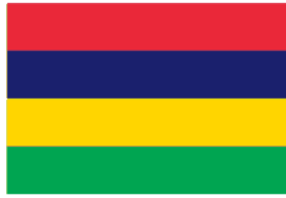
Illustration : DRAPEAU DE MAURICE

Le drapeau de Maurice a été adopté le 12 mars 1968 suite à l'indépendance du pays. Il est constitué de quatre bandes colorées horizontales de mêmes proportions.